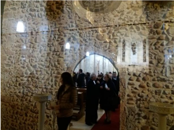
2018-2019 Giubileo Lasalliano : la Porta Santa nel Santuario di S.Giovanni Battista De La Salle