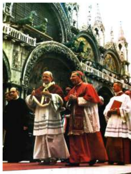
Venezia 16 settembre 1972- Paolo VI con il suo successore card. Albino Luciani

S. Paolo VI saprà dall'alto sostenere la Scuola Cattolica di cui è ex Alunno e che ha sempre onorato con la Sua stima e simpatia