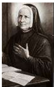
Santa Paola Frassinetti