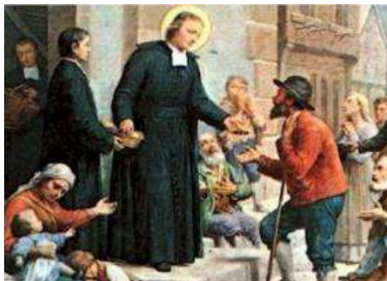
S.Giovanni Battista De La Salle