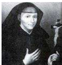
Santa Brigida Morello