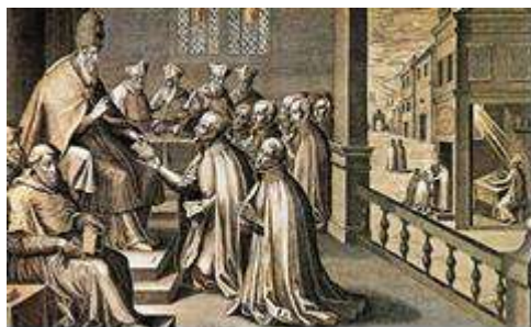
S. Ignazio di Loyola