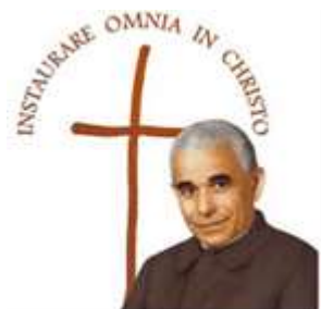
S. Luigi Orione