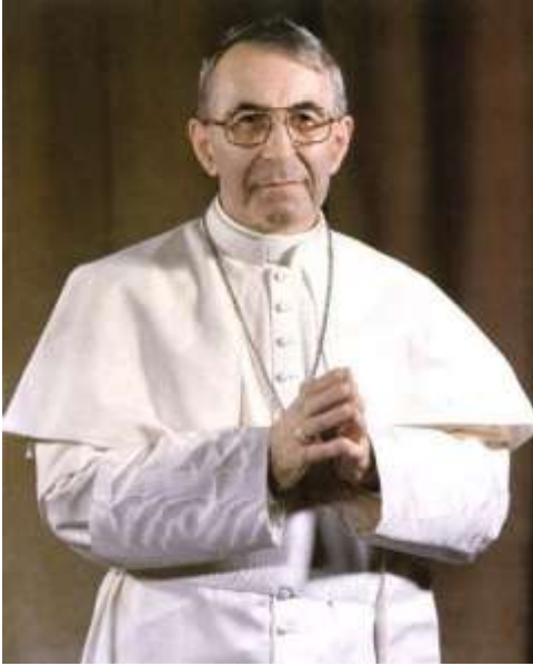
Confederinfo3Ve n. 10

vive nel gregge e per il gregge dei fedeli, che parla per sapienza e attrae le anime con le parole del Vangelo” scrive il card. Pietro Parolin segretario di Stato nella prefazione del libro “Albino Luciani Giovanni Paolo I un uomo di Dio un papa santo” Dopo solo 33 giorni di pontificato in cui tutto il mondo ha avuto modo di conoscerlo e di stimarlo, Giovanni Paolo I viene trovato morto nel letto che era stato di S. Giovanni XXIII, nella sua camera dei Palazzi Apostolici il 29 settembre 1978. “ Il suo breve pontificato non è stato però il passaggio di una meteora che si spegne dopo un breve tragitto” scrive ancora il card. Parolin nella stessa Prefazione “E’ invece tutt’ora segno ed esempio luminoso di quella continuità di speranze che vengono da lontano e che affondano le radici nel mai dimenticato tesoro di una Chiesa, vicina all’insegnamento dei grandi Padri...egli ha concorso a rafforzare il disegno di una Chiesa conciliare vicina al dolore delle genti ed alla loro sete di carità.”