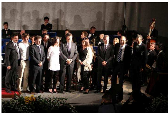
L'Associazione Ex Allievi dell'Istituto Filippin

“Newsletter Confederex” della Confederazione Italiana Ex Alunni ed Ex Alunne della Scuola Cattolica, è una pubblicazione complementare ma non sostitutiva del “Notiziario Confederex”. Sono oggetto di pubblicazione notizie pervenute da Associazioni di Ex Allievi/e di Scuola Cattolica o altri enti, istituzioni e/o soggetti privati, previa revisione da parte del comitato di redazione. Per pubblicazioni, inserzioni, pubblicità e notizie scrivere all'indirizzo E mail info@confederex.org Comitato di Redazione Newsletter a cura della Confederex Triveneto - © Confederex 2012 - Tutti i diritti riservati