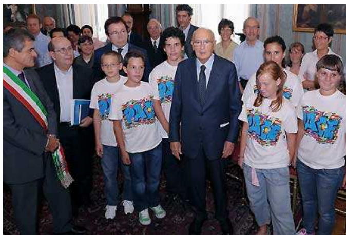
Il presidente della Repubblica Napolitano con Oliviero ed i suoi Giovani, in un incontro al Quirinale

“Newsletter Confederex” della Confederazione Italiana Ex Alunni ed Ex Alunne della Scuola Cattolica, è una pubblicazione complementare ma non sostitutiva del “Notiziario Confederex”. Sono oggetto di pubblicazione notizie pervenute da Associazioni di Ex Allievi/e di Scuola Cattolica o altri enti, istituzioni e/o soggetti privati, previa revisione da parte del comitato di redazione. Per pubblicazioni, inserzioni, pubblicità e notizie scrivere all'indirizzo E mail info@confederex.org Comitato di Redazione Newsletter a cura della Confederex Triveneto - © Confederex 2012 - Tutti i diritti riservati